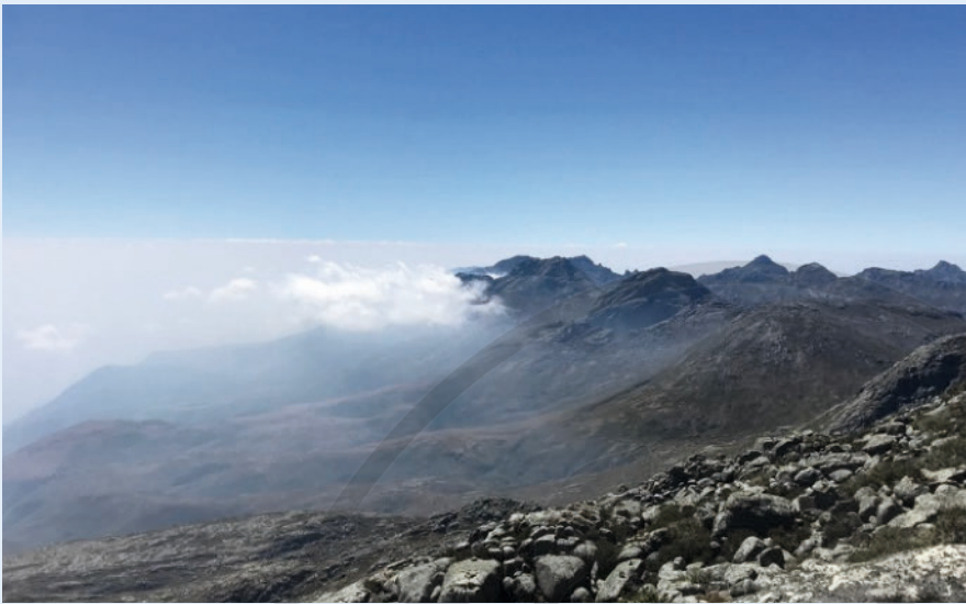
► Abb. 7 Blick vom Gipfel des Mulanje-Massivs.