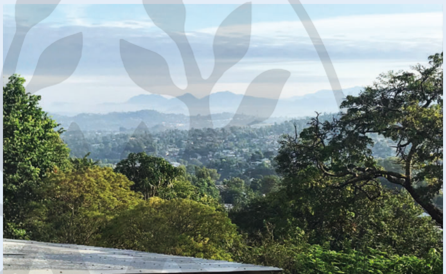
► Abb. 4 Blick von der Terrasse der Kabula Lodge in Blantyre.