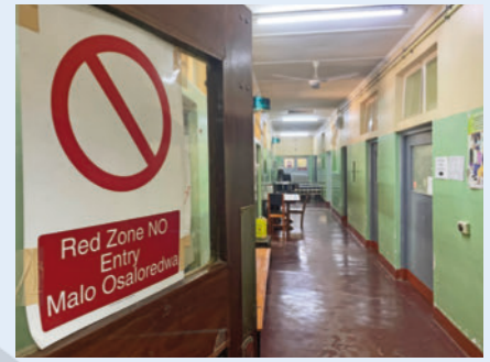
► Abb. 3 COVID-Station des QECH.