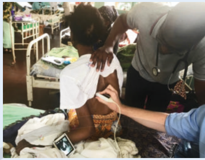
► Abb. 2 Arbeit auf der female medical ward 4a.

Blantyre bietet zahlreiche Unterkünfte unterschiedlicher Preisklassen, häufig mit