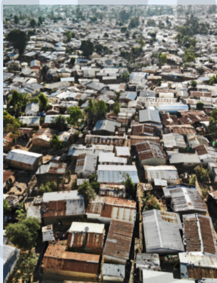
► Abb. 5 Blick auf Ndirande, einer der ärmeren Stadtteile Blantyres.