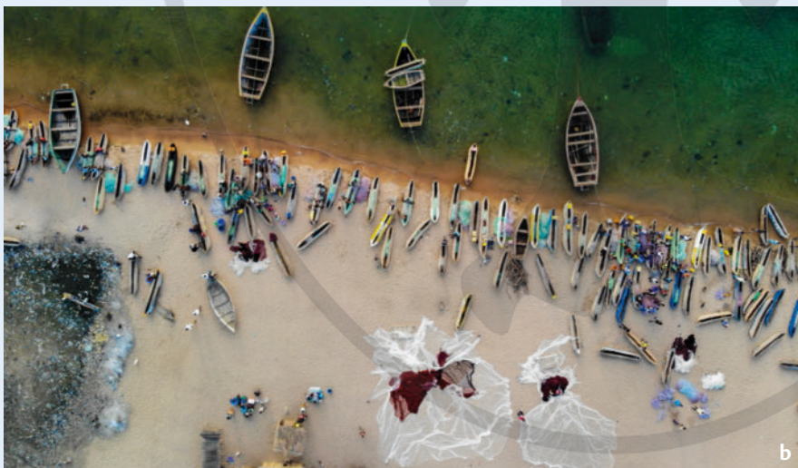
► Abb. 8 Blick auf Domwe Island (a) und auf Fischerboote in Cape Maclear (Chembe) (b).